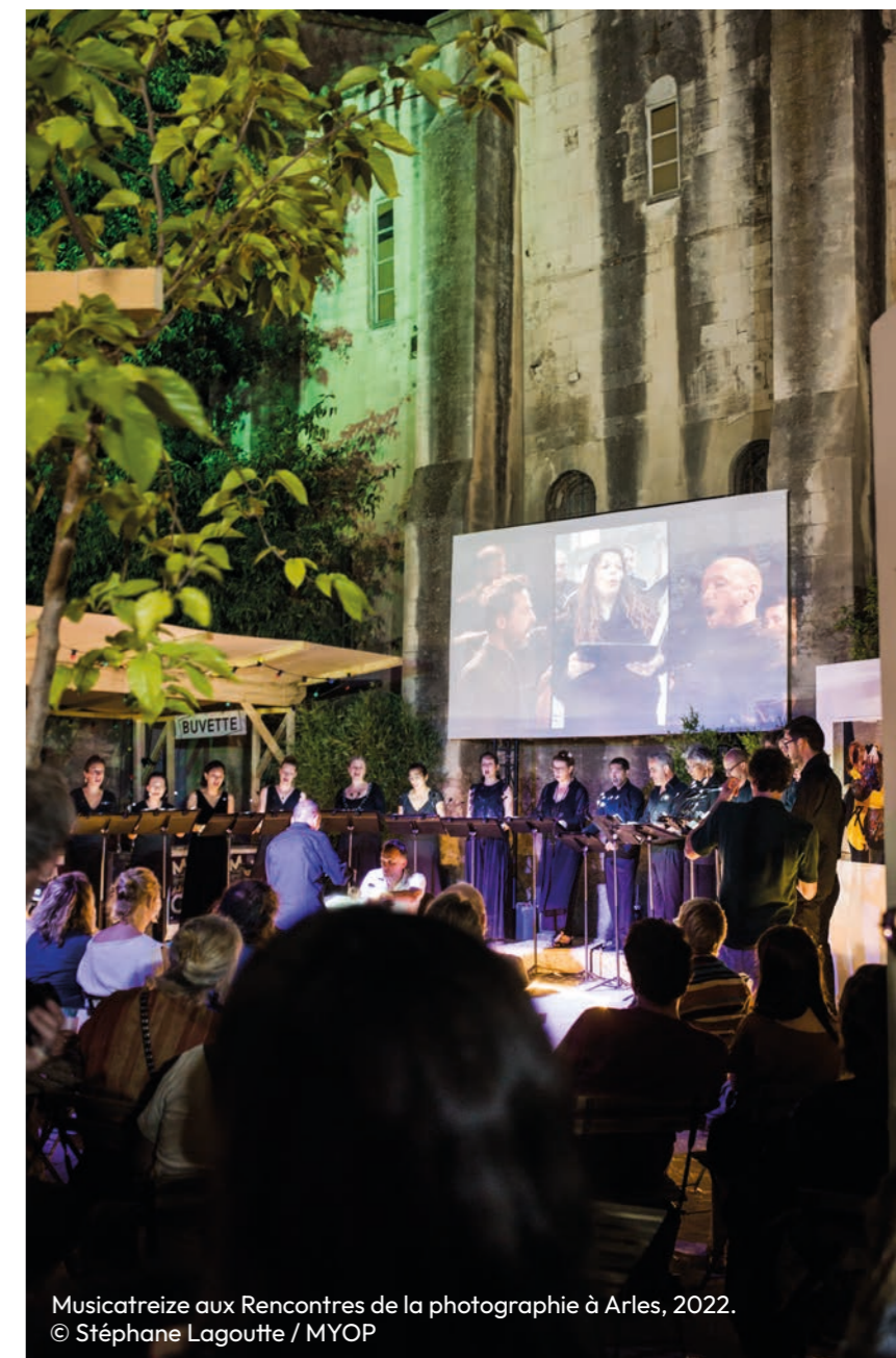
Musicatreize aux Rencontres de la photographie à Arles, 2022.