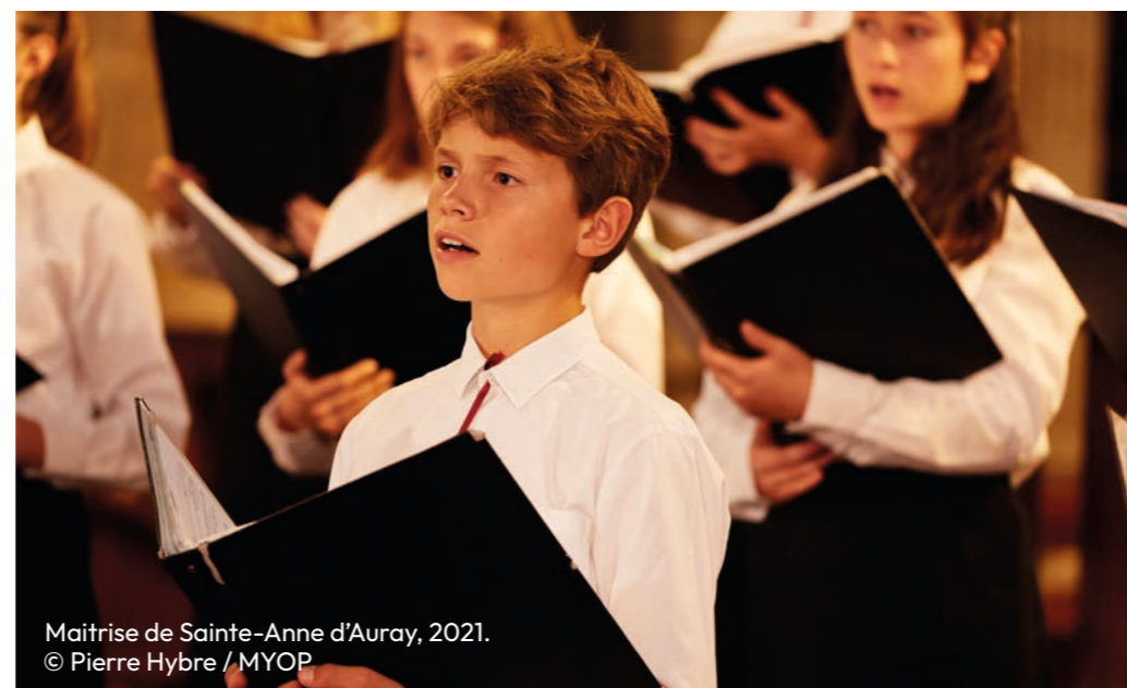
Maîtrise de Sainte-Anne d'Auray, 2021.