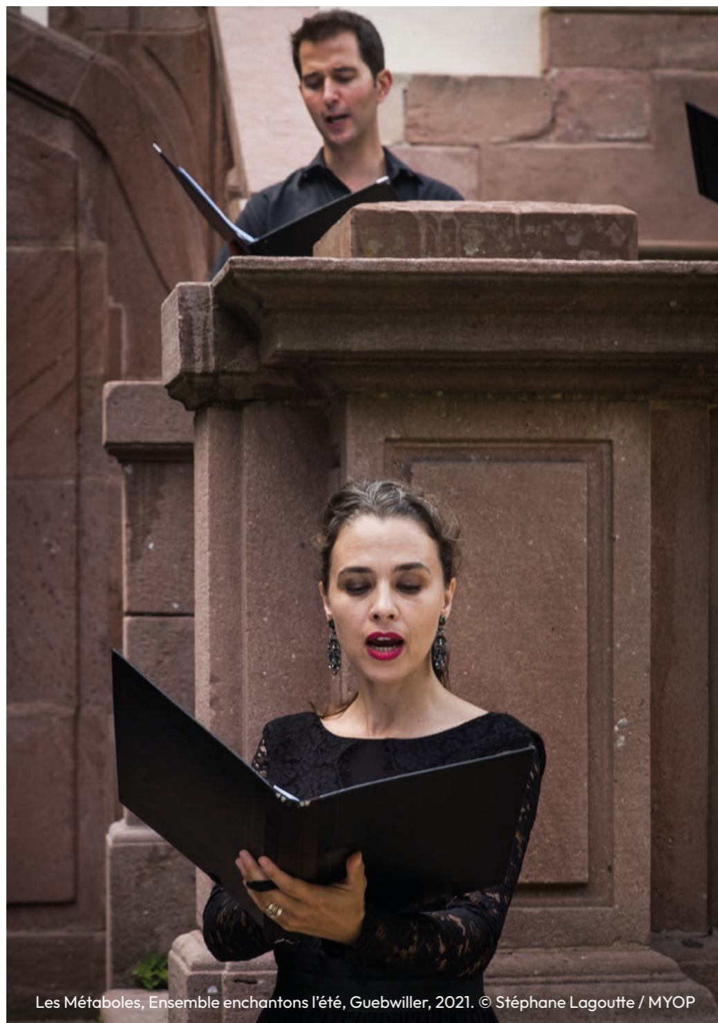
Les Métaboles, Ensemble enchanteons l'été, Guebwiller, 2021.