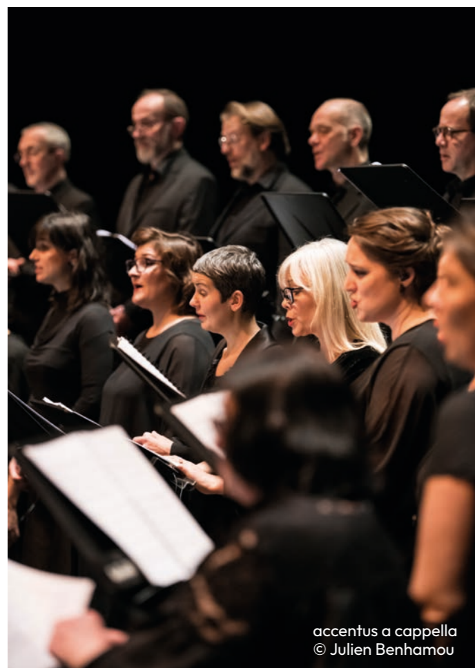
accentus a cappella