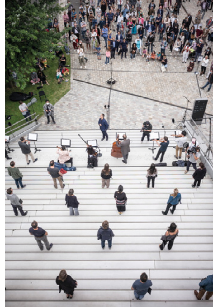
L'ensemble accentus dans le cadre de l'initiative Ensemble, enchantons l'été à la Philharmonie de Paris, 2020

Cette richesse et cette diversité distinguent désormais le festival Chants libres , un événement pensé pour promouvoir le chant choral et offrir à tous ses multiples bienfaits... Une source de joie, de partage et de solidarité.