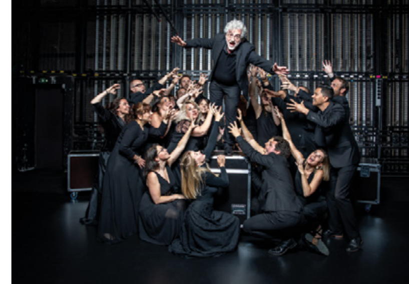
Chœur de chambre Mélisme(s) dirigé par Gildas Pungier