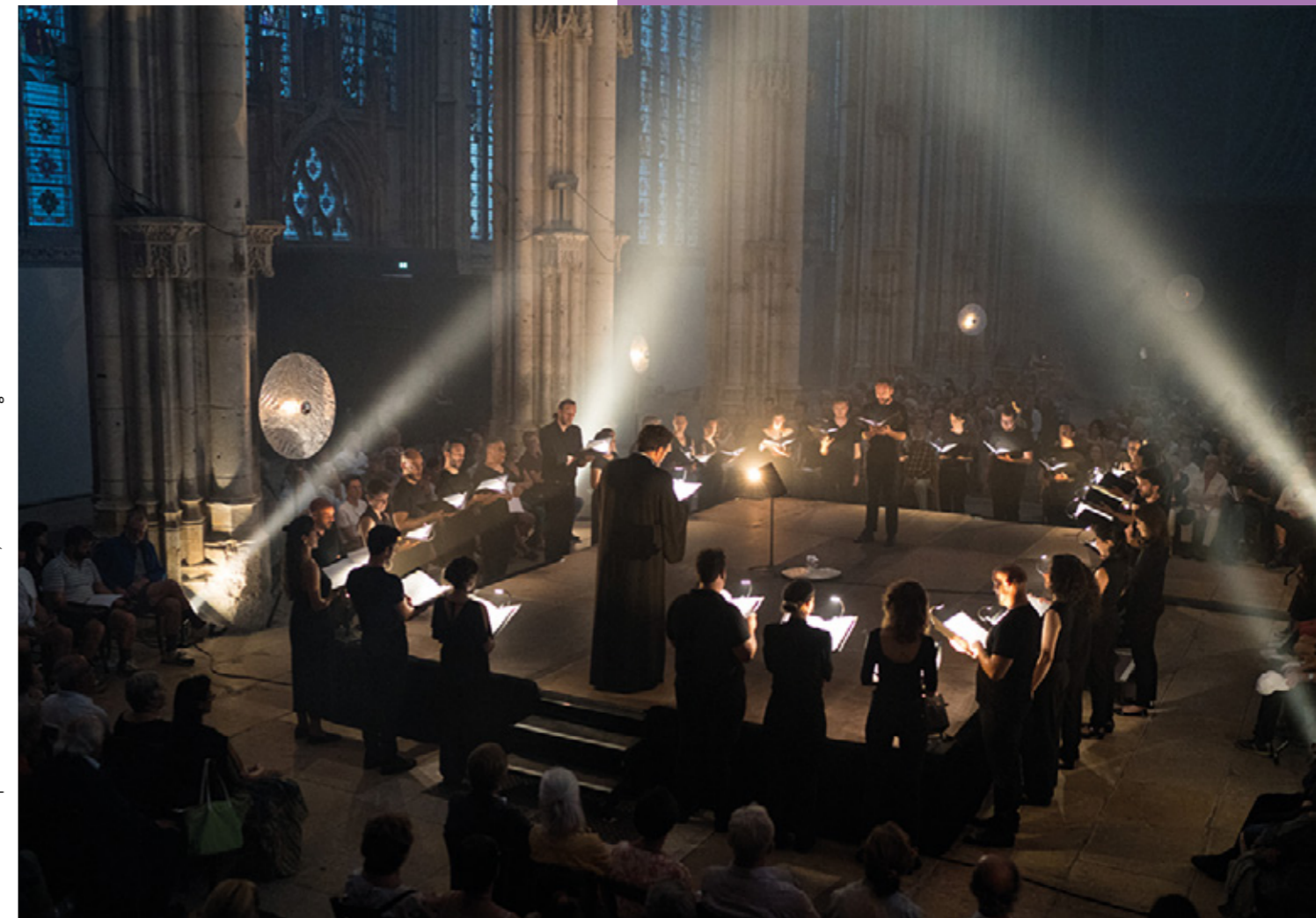
La Tempête lors du concert Nocturne à Rouen, 2022