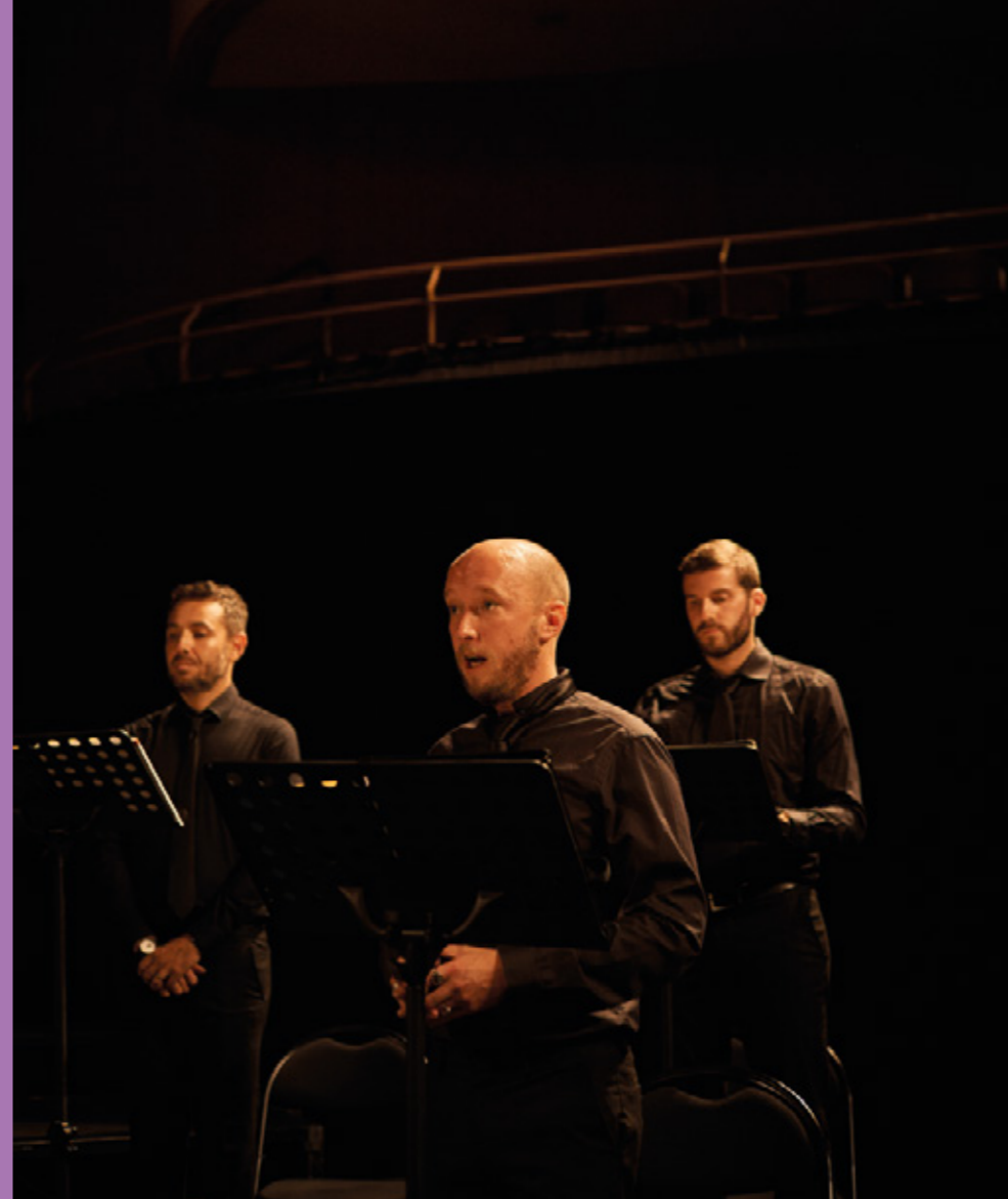
Le Concert Spirituel au Kursaal de Besançon, 2020

16,7 M€ en faveur du chant choral depuis 1989