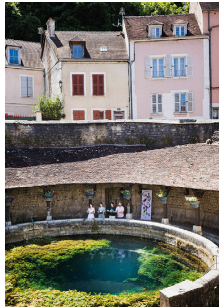
Les Métaboles en quatuor lors d'un concert donné dans le cadre de Chants libres à la Fosse Dionne de Tonnerre, 2023