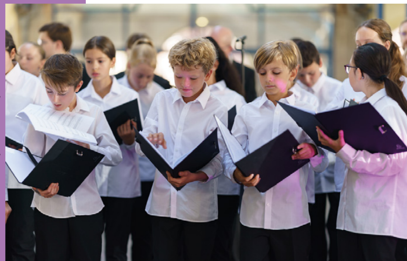
La maîtrise Sainte-Philomène de Haguenau © Emmanuel Viverge