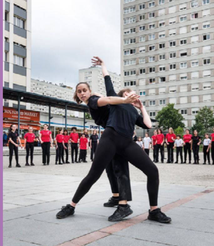
La Maîtrise Populaire de l'Opéra-Comique lors d'un concert de Chants libres sur la place des Fêtes à Paris, 2021