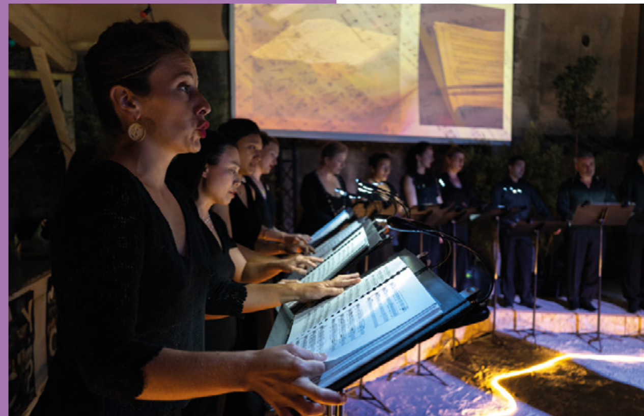
Le chœur Musicatrente lors du concert donné dans le cadre de Chants libres à Arles, 2022