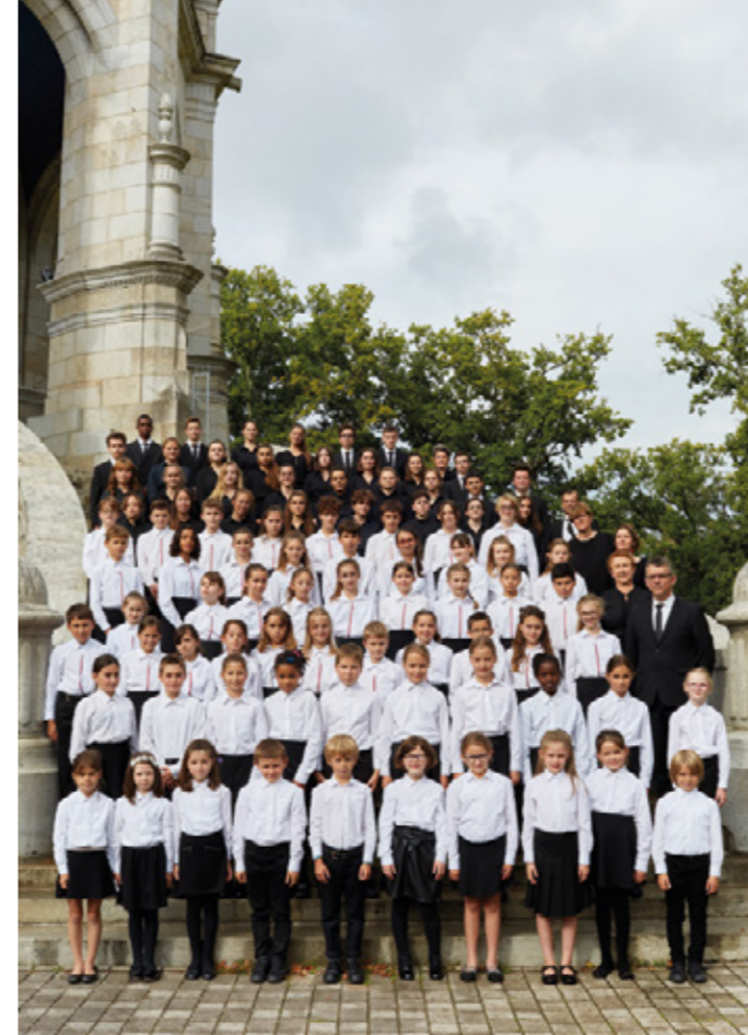
Chœur de la Maîtrise de Sainte-Anne-d'Auray à la basilique de Sainte-Anne-d'Auray, 2021