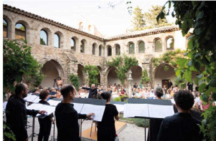
Musicatreize et le chœur de chambre 1732 lors d'un concert donné dans le cadre de Chants libres au Cloître du domaine Sainte-Roseline, Arcs-sur-Argens, 2023