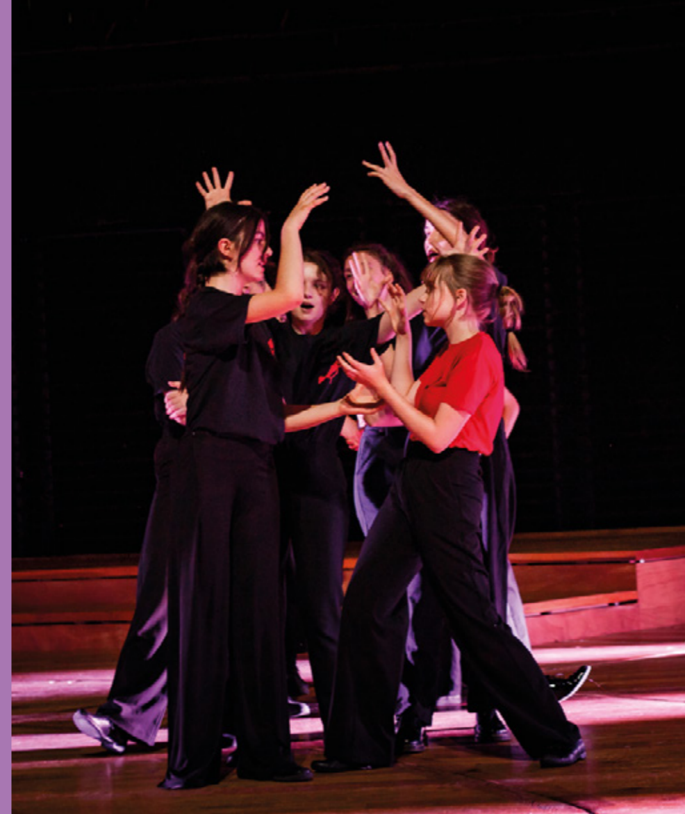
Concert final de Chants libres à la Philharmonie de Paris en 2023