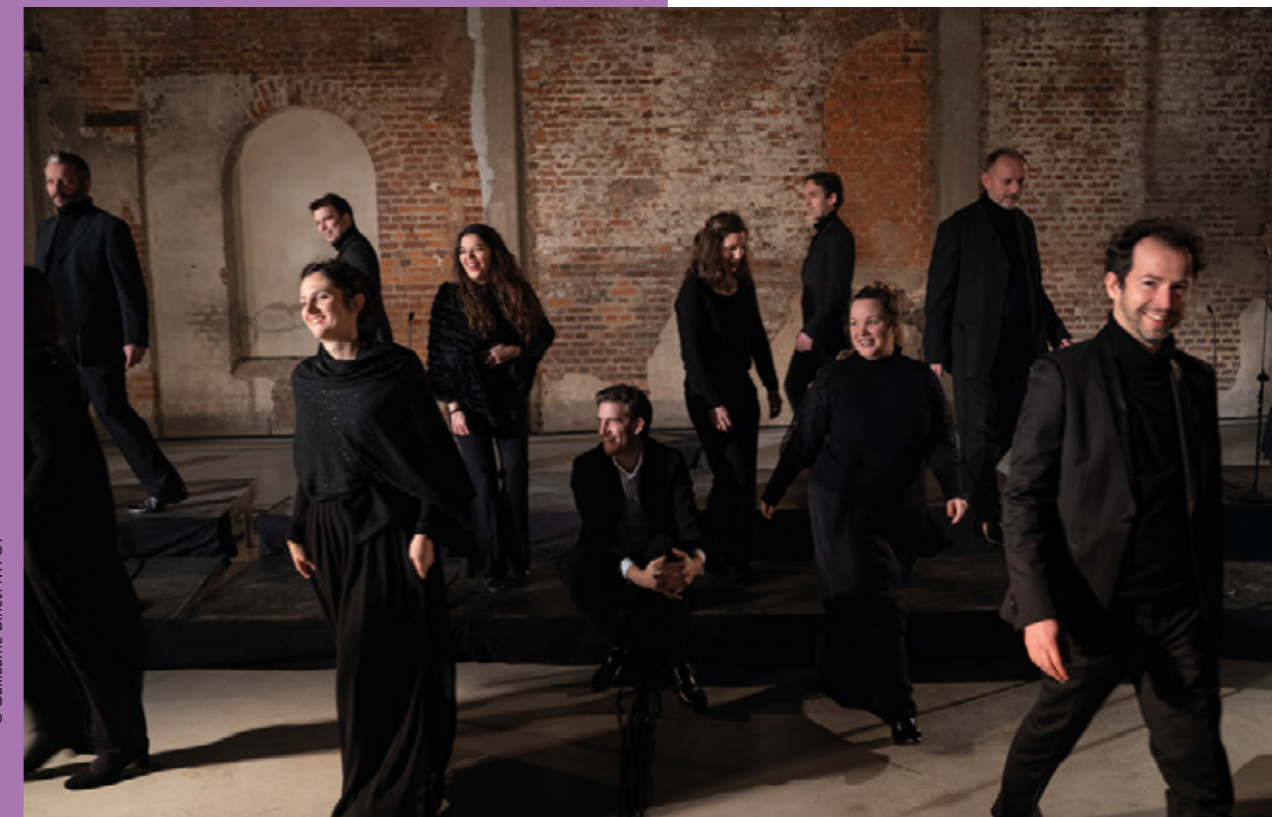
Les Métaboles lors d'un concert donné dans le cadre de Chants libres, dans la halle verrière du Centre International d'art-verrier de Meisenthal, 2021