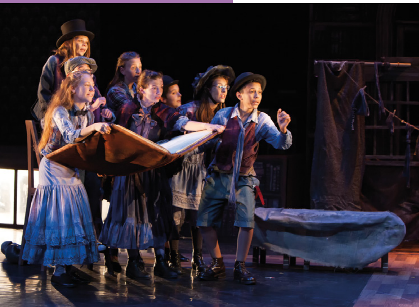
Le CRÉA pendant le concert Élémentaire mon cher en 2018