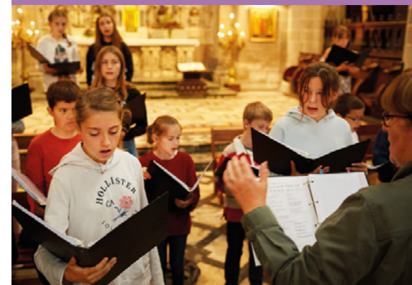
Maîtrise de Sainte-Anne-d'Auray à la basilique de Sainte-Anne-d'Auray, 2021