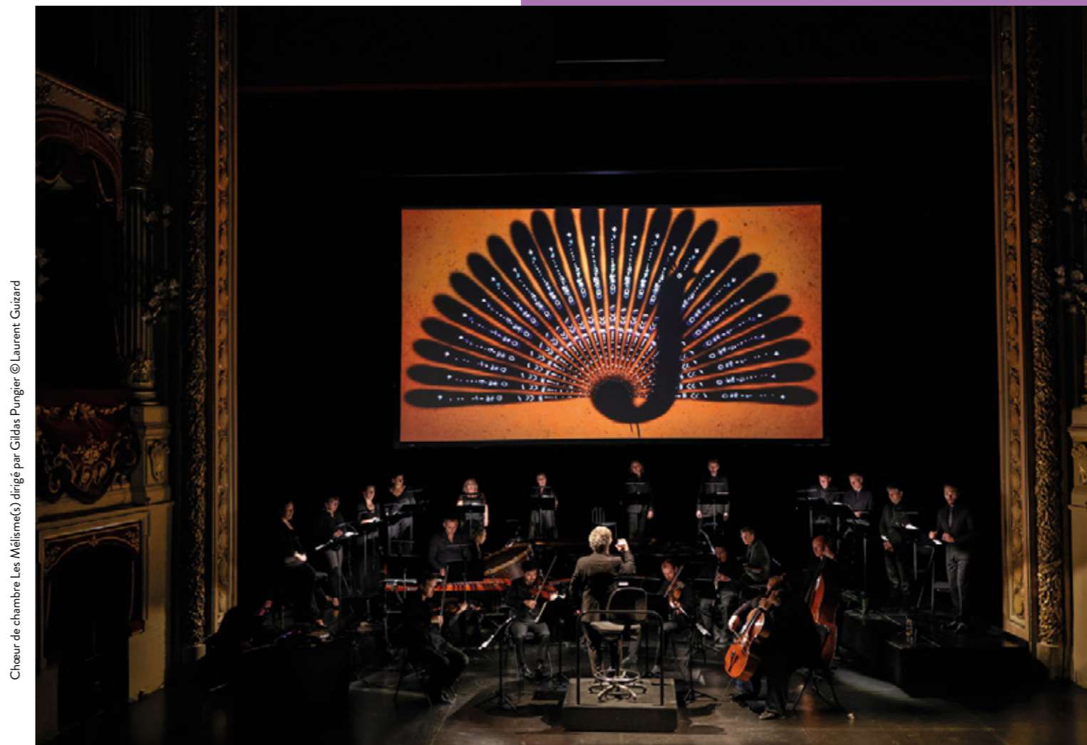
Chœur de chambre Les Mélismes dirigé par Gildas Pungier