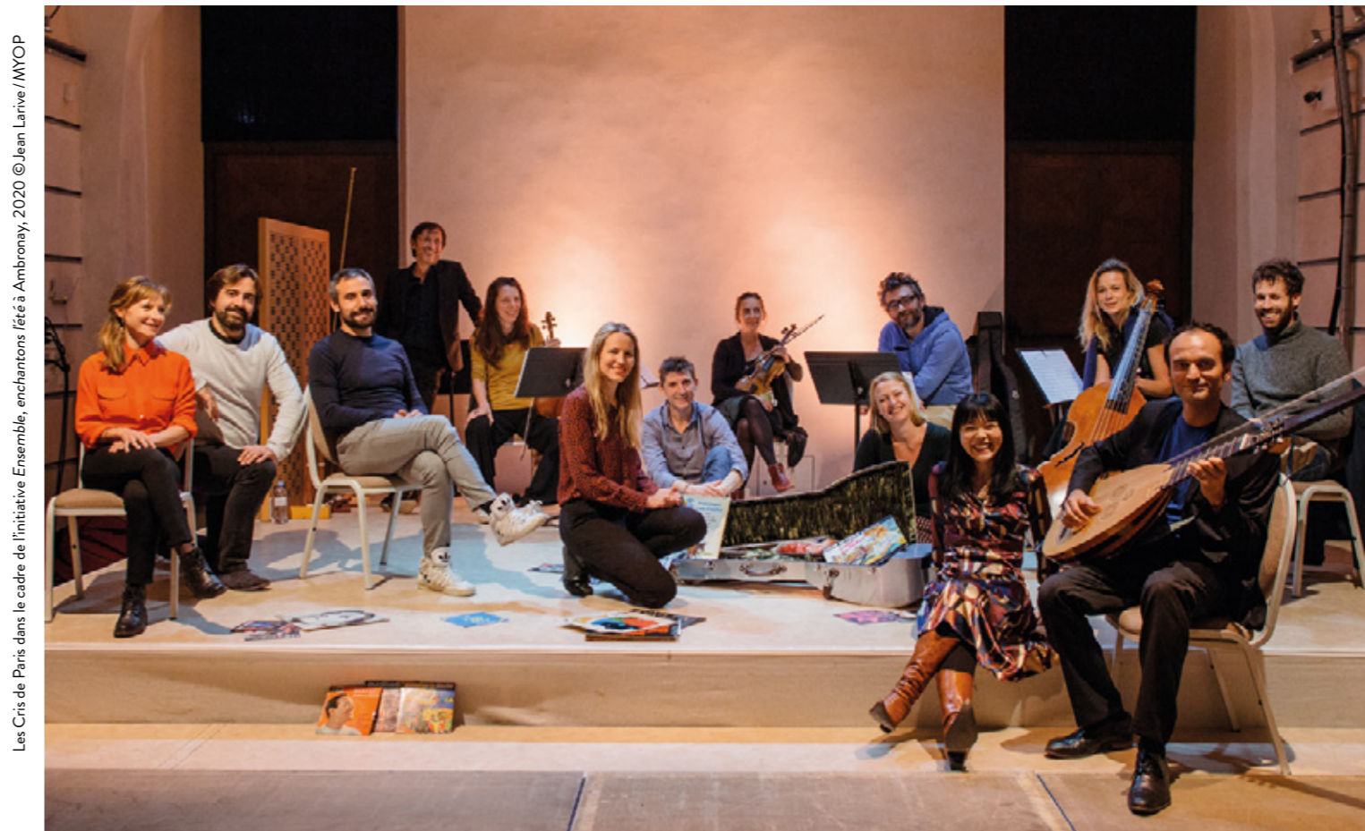
Les Cris de Paris dans le cadre de l'initiative Ensemble, enchantements lété à Ambroisy, 2020